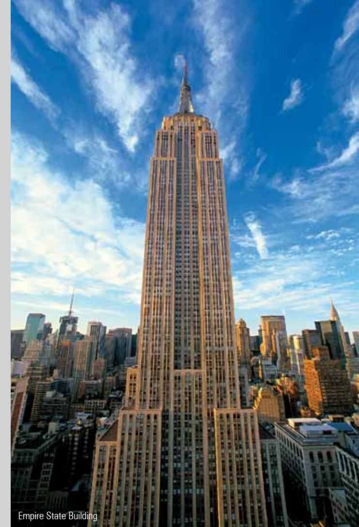
Empire State Building

Berenholtz produces enthrallingly beautiful portraits of buildings, often recasting widely known motives as a new and spectacular visual experience. Along with familiar landmarks, he also reveals to us the uncharted side of the megalopolis.