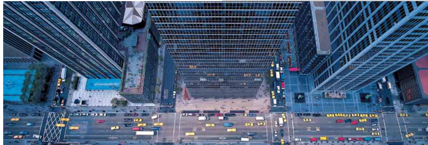
Avenue of the Americas

Die Kamera gewährt seltene Nahaufnahme auf fesselnde Details und bahnt Einblick in das verborgene Innenleben der Gebäude. Eine besondere Liebe gehört dem Art Deco der 1930er Jahre; doch auch die jüngsten, himmelstürmenden Gebilde von Norman Foster und Frank Gehry fokussiert Berenholtz in schwindelnder Perspektive. Seine Aufnahmen faszinieren durch ihren mitreißenden Sog dynamischer Raumfluchtung. Der Streifzug durch hundert Jahre Architekturgeschichte wird zugleich ein genussvolles Fest fürs Auge.