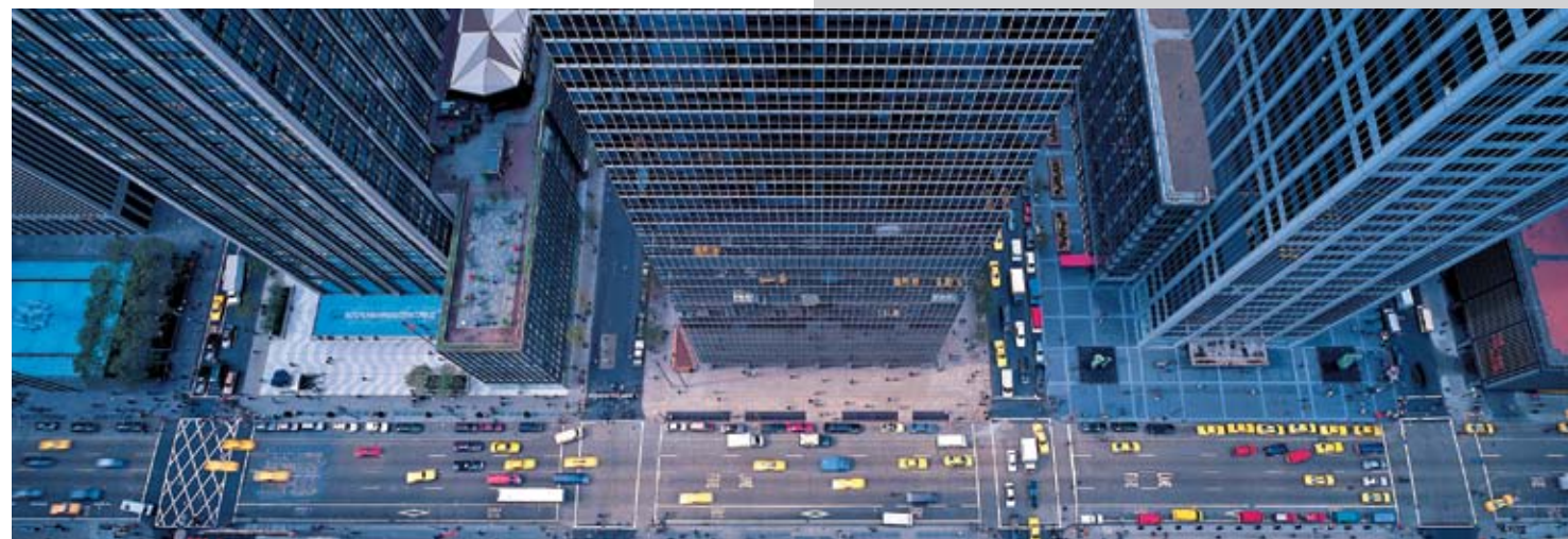
Avenue of the Americas

Die Kamera gewährt seltene Nahaufnahme auf fesselnde Details und bahnt Einblick in das verborgene Innenleben der Gebäude. Eine besondere Liebe gehört dem Art Deco der 1930er Jahre; doch auch die jüngsten, himmelstürmenden Gebilde von Norman Foster und Frank Gehry fokussiert Berenholtz in schwindelnder Perspektive. Seine Aufnahmen faszinieren durch ihren mitreißenden Sog dynamischer Raumfluchtung. Der Streifzug durch hundert Jahre Architekturgeschichte wird zugleich ein genussvolles Fest fürs Auge.