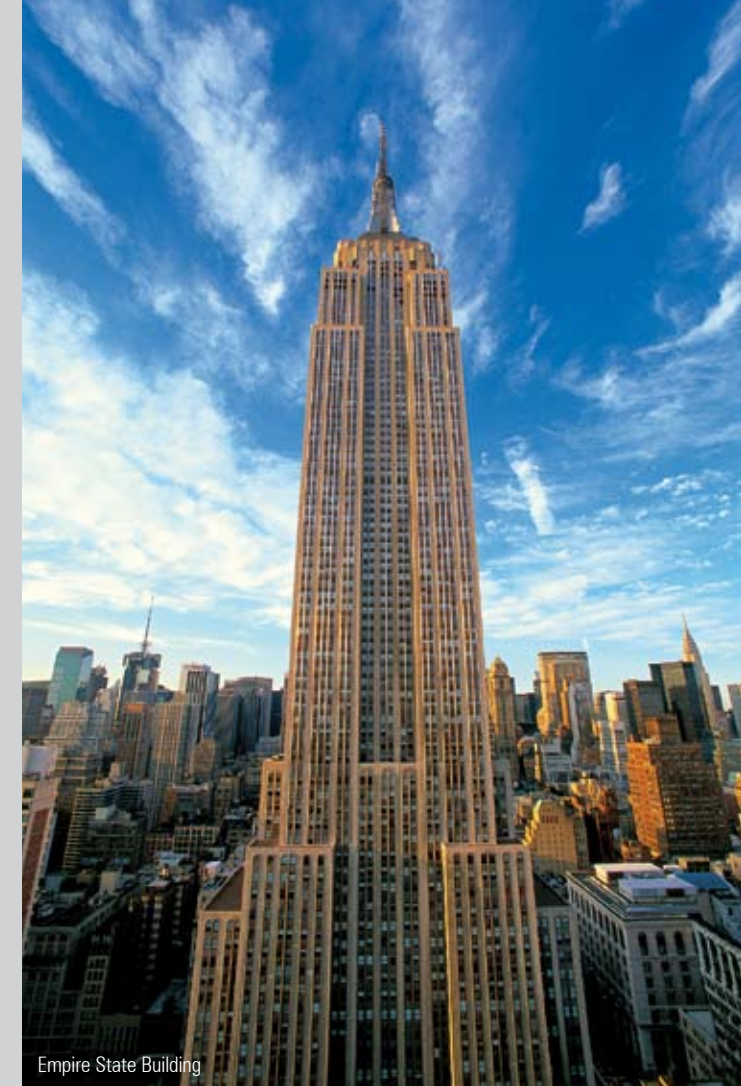
Empire State Building

Berenholtz produces enthrallingly beautiful portraits of buildings, often recasting widely known motives as a new and spectacular visual experience. Along with familiar landmarks, he also reveals to us the uncharted side of the megalopolis.